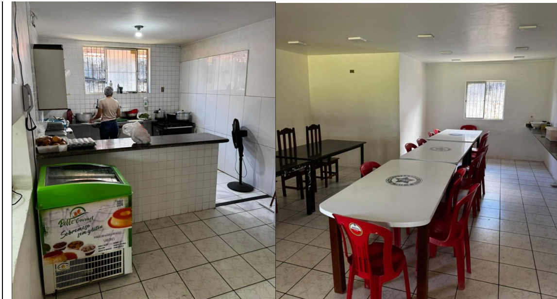
Figura 8: Ônibus arrendado pelo clube para deslocamento; Figura 9: Sala de massagem e fisioterapia do clube; Figuras 10 e 11: Refeitório e cozinha do clube

65. A equipe verificou que, embora algumas dependências demandem investimentos de manutenção e modernização — notadamente a finalização dos dormitórios dos atletas e comissão técnica —, a estrutura está em condições operacionais para o exercício regular das atividades desportivas e administrativas do PARNAHYBA, considerando sua capacidade atual.