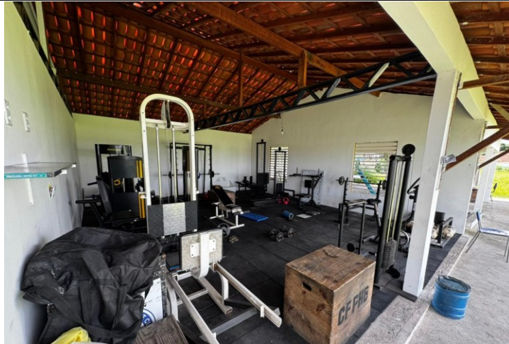
Figura 6: Sala de musculação dos atletas