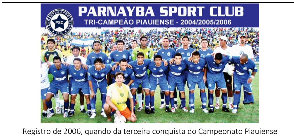
Registro de 2006, quando da terceira conquista do Campeonato Piauiense

10. Entre suas conquistas, estão 13 títulos do Campeonato Piauiense (1916, 1919, 1924, 1925, 1927, 1929, 1930, 1940, 2004, 2005, 2006, 2012 e 2013). Foi o clube tricampeão contínuo do Campeonato Piauiense: 2004, 2005 e 2006. Acumula 3 vitórias da Taça Estado do Piauí (2004, 2012 e 2017). Mais recentemente, foi Vice-Campeão em 2022 e 2024.