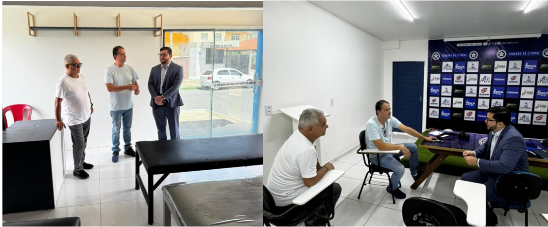
Figura 1: Frente do CT Petronio Portela; principal estabelecimento do PARNAHYBA; Figuras 2 e 3: Recepção da equipe da LRF Líderes no dia 31/3/2026 na sede do clube.