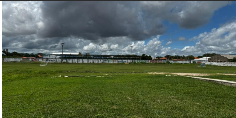
Figura 7: Gramado do CT Petrônio Portela