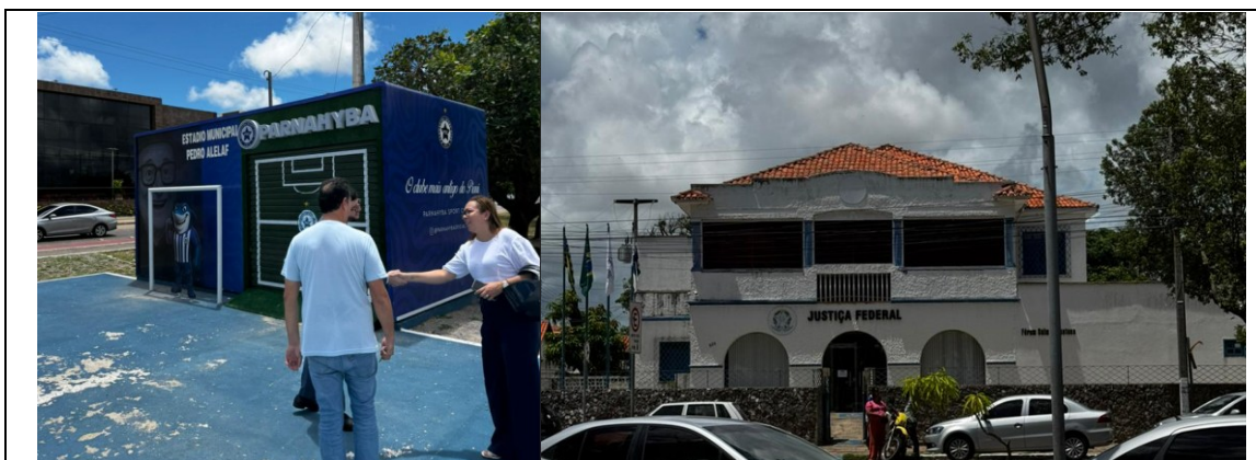
Figura 12: Ponto de venda de produtos do clube; Figura 13: Imóvel do clube locado à JFPI

66. Os trabalhos de visita técnica foram desenvolvidos entre as 9h até às 17h, incluindo a visitação em todas a extensão do CT Petrônio Portela (suas dependências, estrutura física para os treinamentos e de acomodação dos jogadores, salas da diretoria etc.), bem como o ponto de venda de produtos do clube (camisas, acessórios etc.) e o imóvel locado à JFPI situado na Rua Humberto de Campos, 634, Centro, Parnaíba/PI, de titularidade do clube: