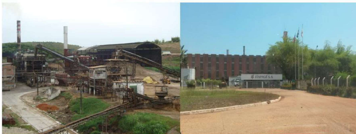
(Cepasa S/A e Itapagé S/A)

Após açúcar, cimento e celulose, o GRUPO JOÃO SANTOS diversificou sua área de atuação ainda mais, ao ponto de, na década de 90, ser formado, também, por empresas dos ramos do agronegócio (a exemplo da Itaguatinga Agro Industrial S/A, Itaberaba Agropecuária Ltda. e Itabuna Agropecuária Ltda. - 5ª, 29ª e 30ª Requerentes), comunicação (Nassau Gráfica do Nordeste S/A, Nassau Editora, Rádio E Televisão Ltda. e Tribuna Publicidade Ltda., (26ª, 41ª e 43ª Requerentes) e serviços , como, por exemplo, na área de Táxi Aéreo e Logística (Sociedade de Táxi Aéreo Weston Ltda. - 42ª Requerente), espalhadas em 14 (catorze) Estados do Brasil.